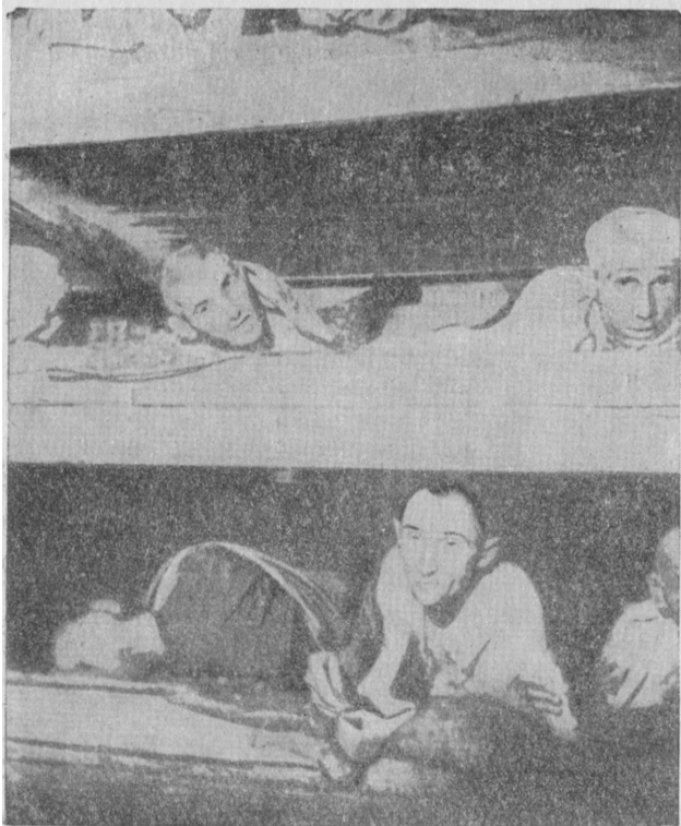
Рис. 19. Нары для заключенных