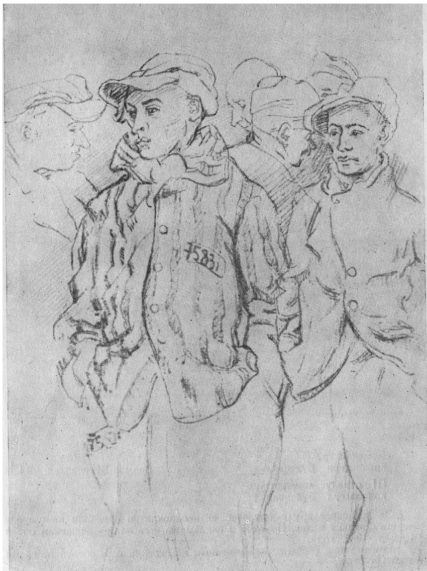
Рис. 21. «Заклученные французы», рисунок Бориса Таслицкого, Франция