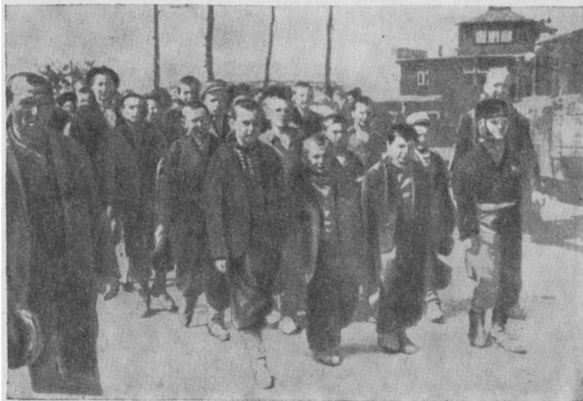
Рис. 31. Выход детей из лагеря