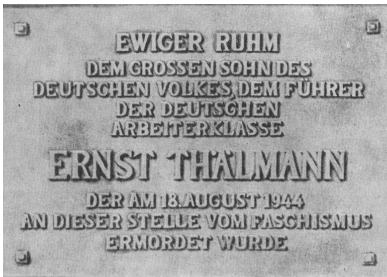
Рис. 59. Мемориальная доска на стене крематория:

ВЕЧНАЯ СЛАВА ВЕЛИКОМУ СЫНУ НЕМЕЦКОГО НАРОДА, ВОЖДЮ НЕМЕЦКОГО РАБОЧЕГО КЛАССА ЭРНСТУ ТЕЛЬМАНУ УБИТОМУ ФАШИСТАМИ НА ЭТОМ МЕСТЕ 18 АВГУСТА 1944 ГОДА