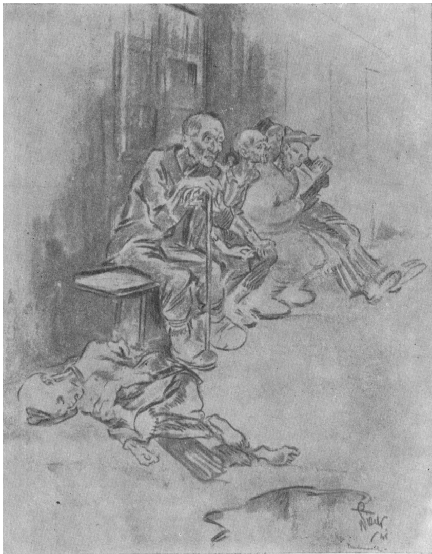
Рис. 33. «Ожидают приема в лазарете», рисунок Генри Пика, Голландия