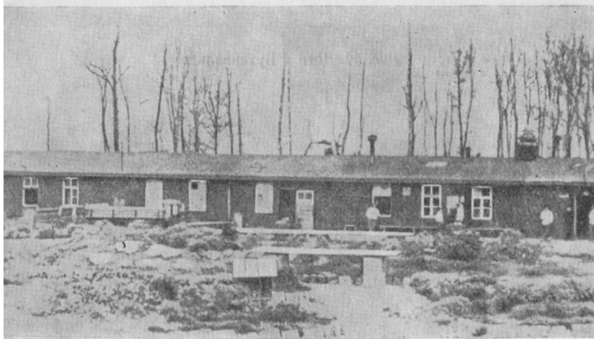
Рис. 32. Здание лазарета